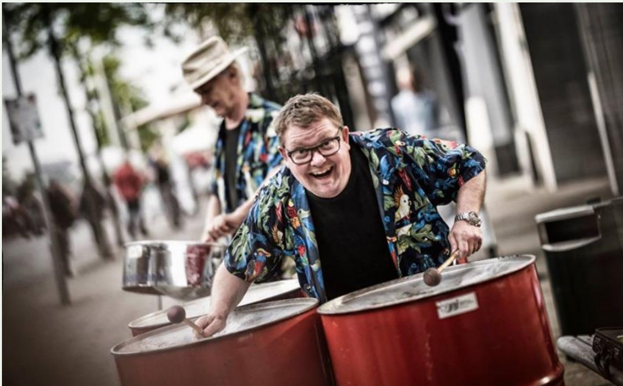
Lys Aften i Skanderborg

Vi ønsker at komme tættere på borgerne og være mere synlige for derigennem at skabe den bedst mulige relation til borgere, foreninger og andre samarbejdspartnere.