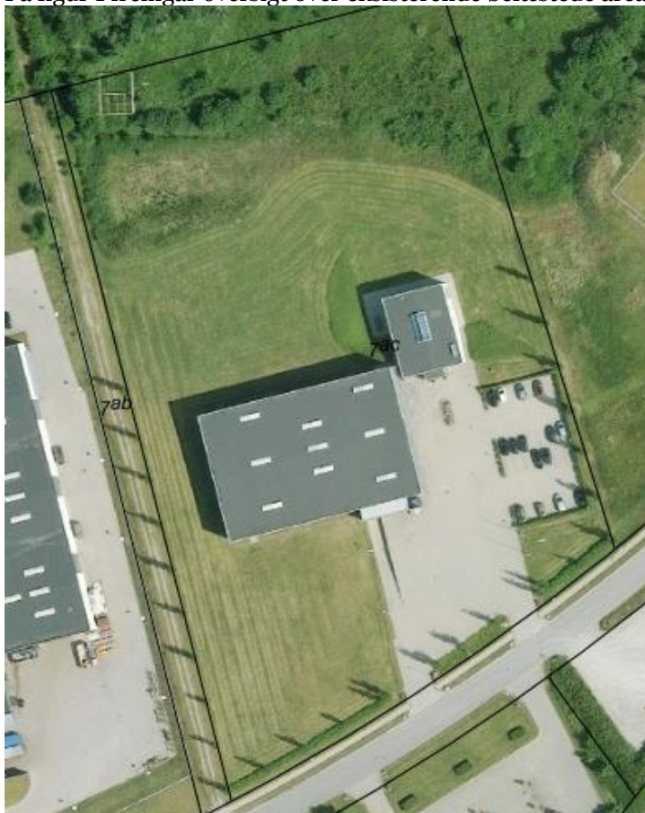
Figur 1 Eksisterende befæstede areal.

På figur 1 fremgår oversigt over eksisterende befæstede arealer.