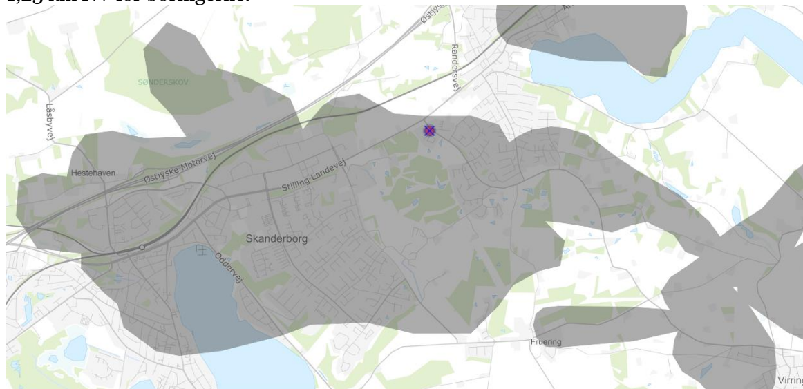
Figur 2 Indvindingsopland til Fredensborgværket.

Projektet ligger i indvindingsopland til Fredensborgværket. Ligeledes er der to drikkevandsboringer på Virringvej hhv. DGU 98.846 og DGU 98.640, rørbassinet placeres hhv. 1,10 km og 1,23 km NV for borerne.