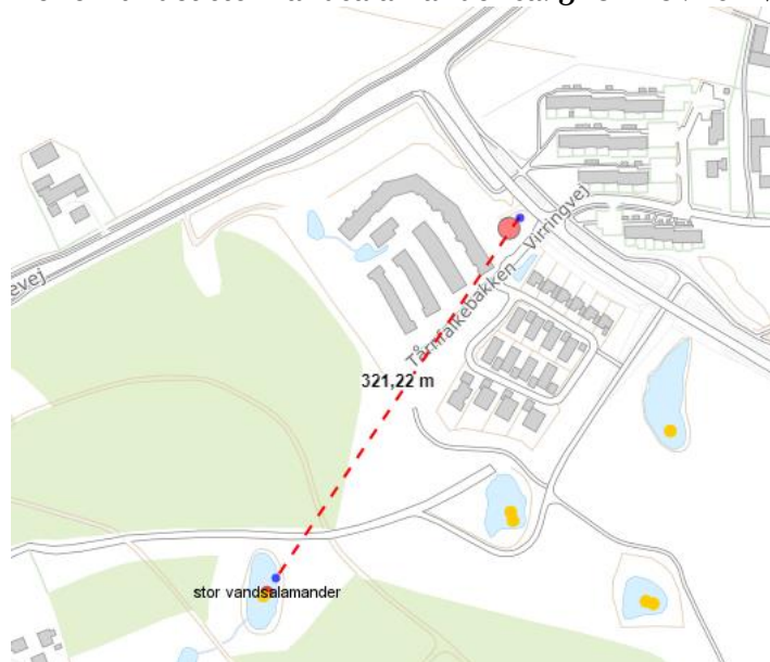
Figur 3 afstand til stor vandsalamander er ca. 320 m

Der er fundet stor vandsalamander ca. 320 m SV for rørbassinets placering.