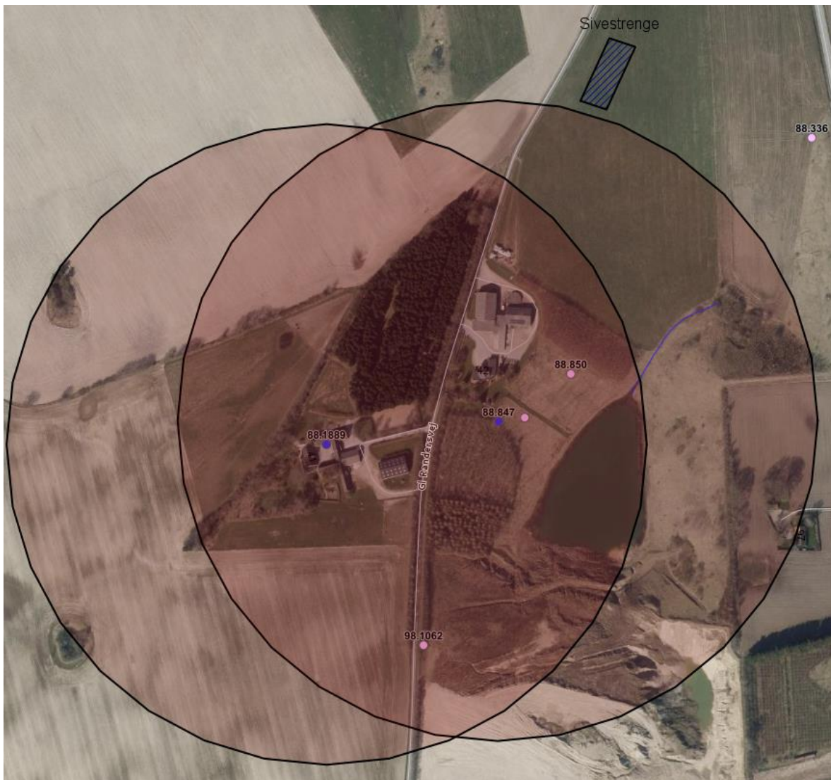
Figur 2 Placering af sivestrenge nord for ejendommen. De 2 runde rødlige zoner, viser 300 m zonen omkring vandboringerne i området.