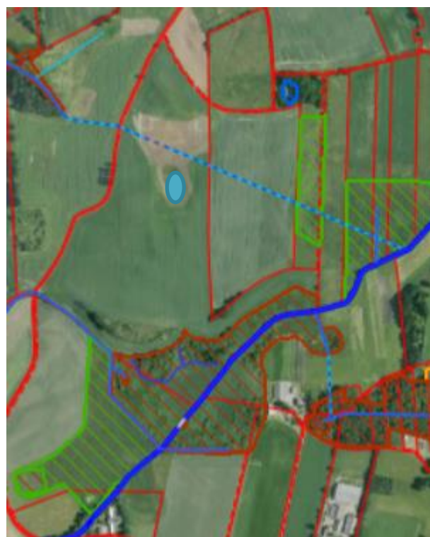
Figur 2: De skraverede områder viser vejledende, hvor der er beskyttet natur jf. § 3 naturbeskyttelsesloven. I disse områder må der ikke udlægges opgravet materiale.