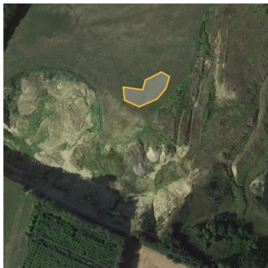
Ansøgt vandhul (nord er til højre i billedet).

Du søger 29. juli 2021 om tilladelse til at etablere et vandhul for at skabe mere dyreliv og for at kunne kontrollere overfladevand. Vandhullet får tilløb af overfladevand, men ikke af drænvand, og der vil være afløb fra vandhullet. Det opgravede materiale skal placeres ved siden af vandhullet. Du har desuden søgt om skovrejsning i området.