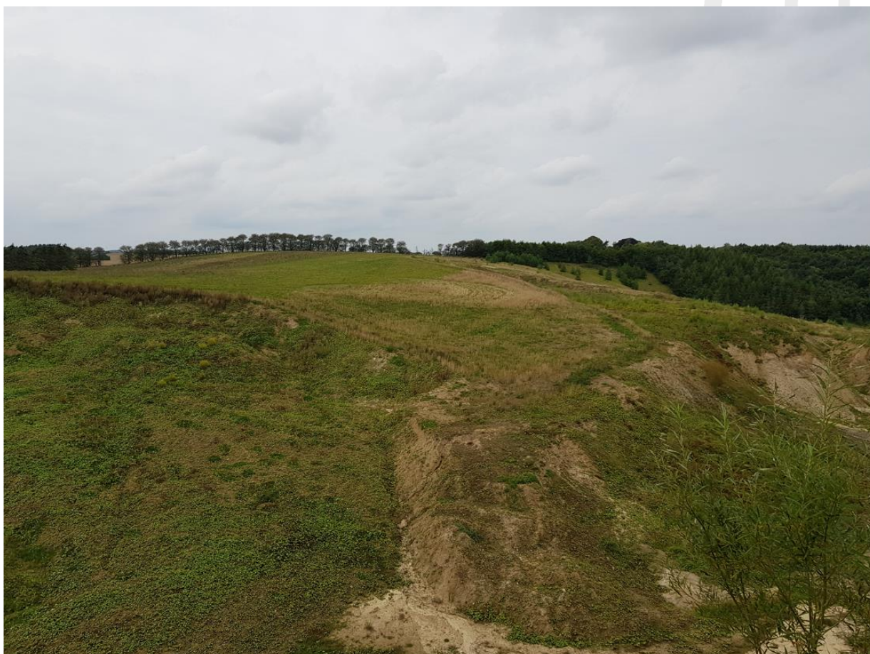
Det lyse, slåede område centralt i billedet viser placeringen af vandhullet

En gennemgang af luftfoto viser, at området omkring vandhullet har være landbrugsjord i omdrift indtil 2014, hvor råstofgravningen ses på luftfoto. Der har ikke være vandhul eller vådområde på noget tidspunkt.