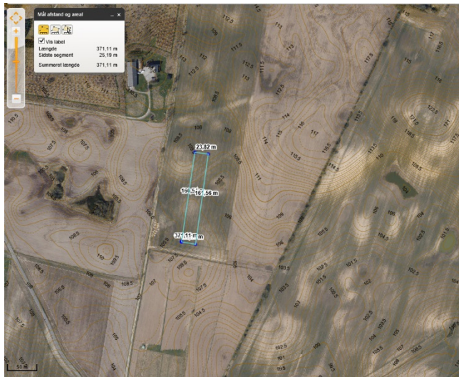
Figur 1-1 Alternativ 1