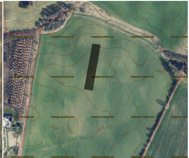
Figur 1-2 Alternativ 2