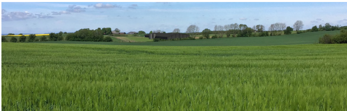
Figur 3-5 Visualisering set fra Hvolbækvej

De nye hønsehuse placeres uden tilknytning til de eksisterende bygninger, fordi det er nødvendigt for en økologisk drift med store hønsegårde hele vejen rundt om hønsehusene. For at sikre, at bygningerne fjernes, når de ikke længere skal bruges til økologisk hønsehold, og behovet for de store udenomsarealer bortfalder, stiller Skanderborg Kommune vilkår om, at bygningerne skal fjernes, når de ikke længere skal anvendes til økologisk hønsehold.