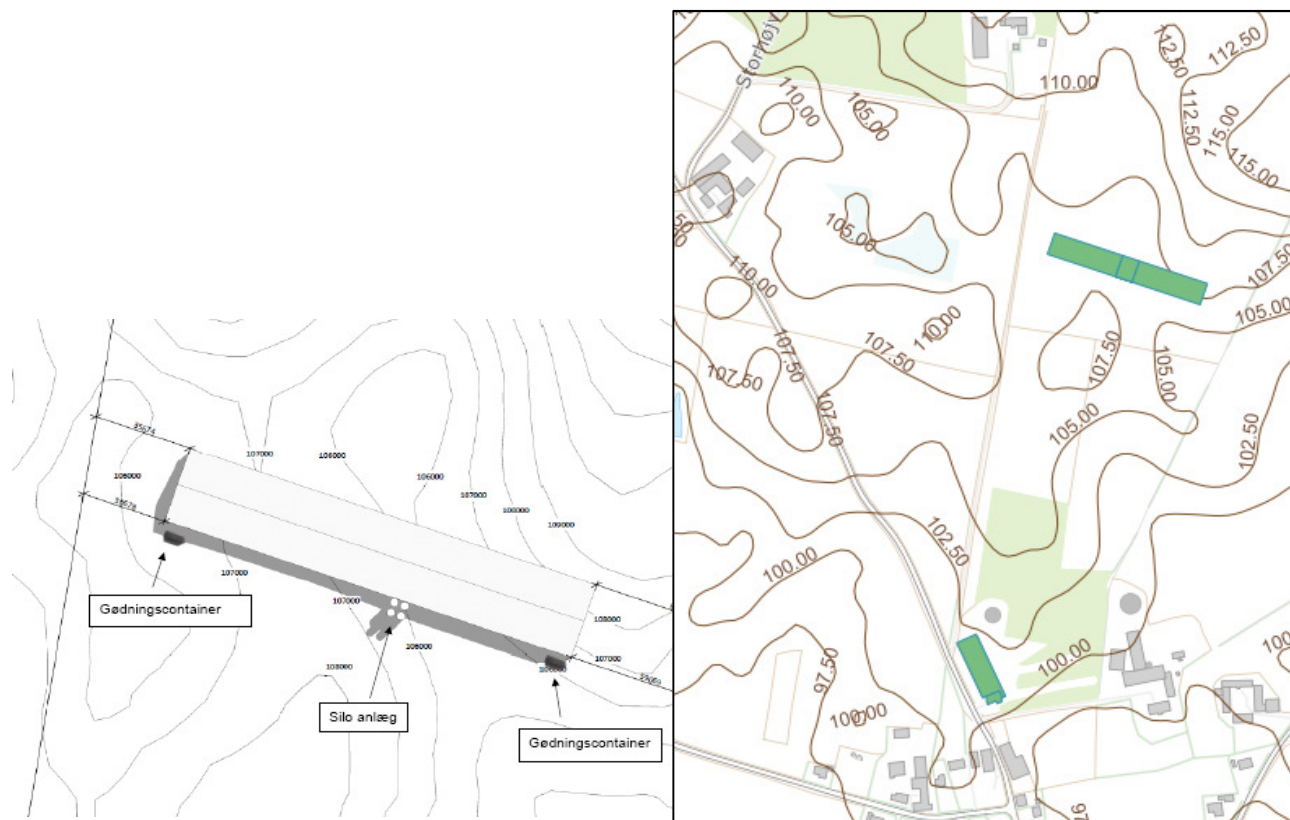
Figur 3-1 Placering af ny stald med tilhørende anlæg

Opbevaring af gødningen fra den eksisterende stald bliver opbevaret i den eksisterende gyllebeholder. Gødning fra de nye stalde opbevares i containere, således gødningen kan leveres til biogas-anlæg løbende gennem året.