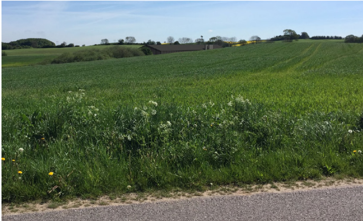
Figur 3-4 Visualisering set fra Storhøjvej