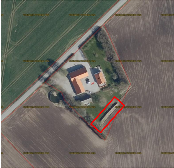
Luftfoto fra foråret 2021, som viser jordvoldens (markeret med rød firkant) placering på ejendommen.