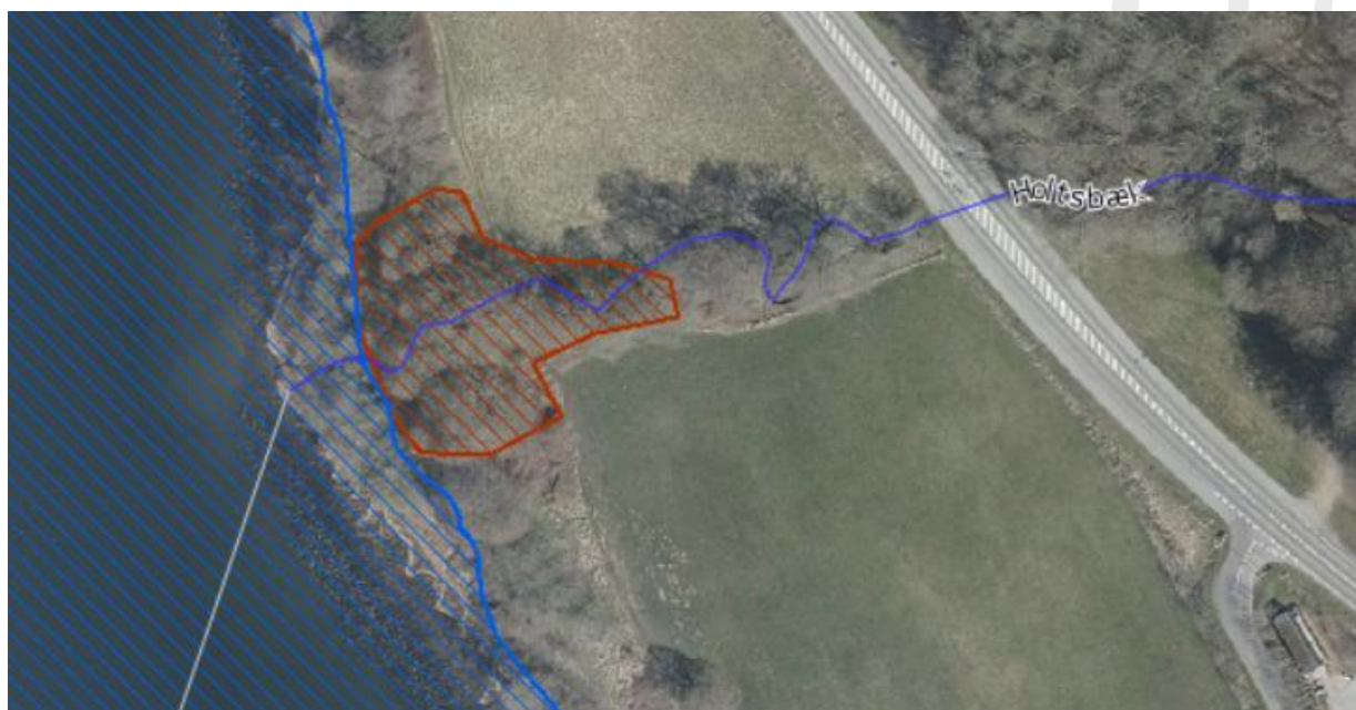
Figur 3: De skraverede områder illustrerer beskyttet natur (vejledende registrering). Selve Holtsbækken er ligeledes beskyttet jf. naturbeskyttelseslovens § 3.