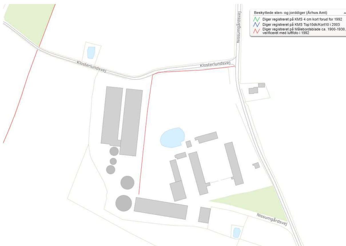
Figur 2-4 Beskyttede diger omkring Nissumgårdsvej 10

For at bevare afskærmning mod ådalen ved Ringkloster å, stilles vilkår om, at den eksisterende beplantning omkring ejendommen bevares.