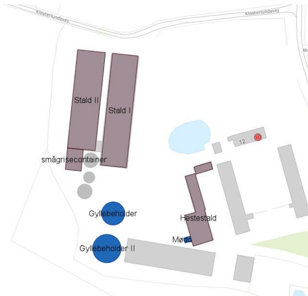
Figur 2-1 Oversigtstegning over stalde og gødningslagre på Nisumgårdsvej 10