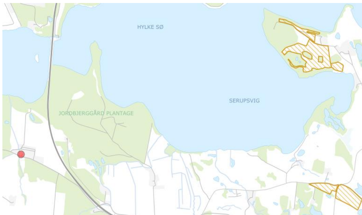
Figur 2-2: Oversigtskort som viser husdyrbruget Hylkevej 3 (rød prik) og to kategori 2 naturområder med overdrev Øst og Nordøst for husdyrbruget (gult skraveret), hvortil der er lavet beregning af ammoniakdeposition på Husdyrgodkendelse.dk.

De nærmeste kategori 2 naturområder er to overdrev, som ligger 2,8 km øst og nordøst for husdyranlægget (se Figur 2-3).