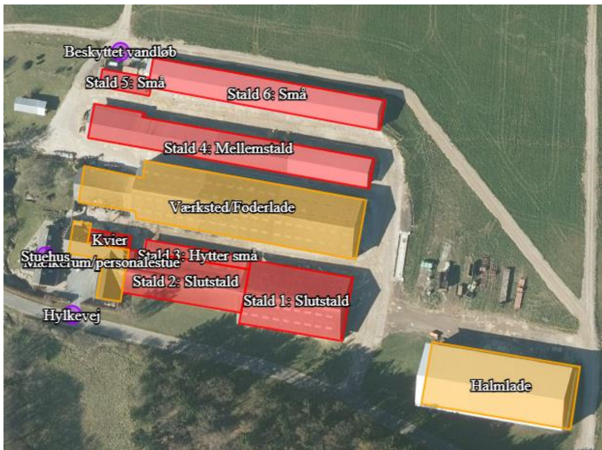
Figur 2-1: Oversigtskort over stalde og andre anlæg på Hylkevej 3.

Der søges om tilladelse til en eksisterende husdyrproduktion efter Husdyrbrugloven §16 b til kødkvæg og slagtekalveopdræt. Figur 2-1 viser en oversigt over stalde, der søges tilladelse til.