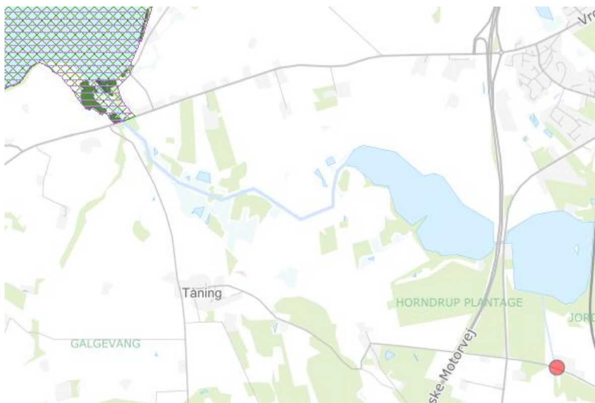
Figur 2-2: Oversigtskort som viser husdyrbruget på Hylkevej 3 (rød prik) og natura 2000 området (skravet) og kategori 1 natur (mørkegrøn) ved Mossø, hvortil der er lavet beregning af ammoniakdeposition på Husdyrgodkendelse.dk.

Nærmeste kategori 1-natur beliggende indenfor internationale beskyttelsesområder (natura 2000) er Elle- og askeskov, som ligger i område nr. 48, Salten Å, Salten Langsø, Mossø og søer syd for Salten Langsø og dele af Gudenåen, som ligger 4 km nordvest for anlægget (se Figur 2-2). Kategori 1 naturen ved Mossø består af habitatområder og fuglebeskyttelsesområder, som ikke er ammoniakfølsomme naturtyper, hvilket betyder, at naturtyperne ikke påvirkes af ammoniakdepositionen fra husdyrbruget.