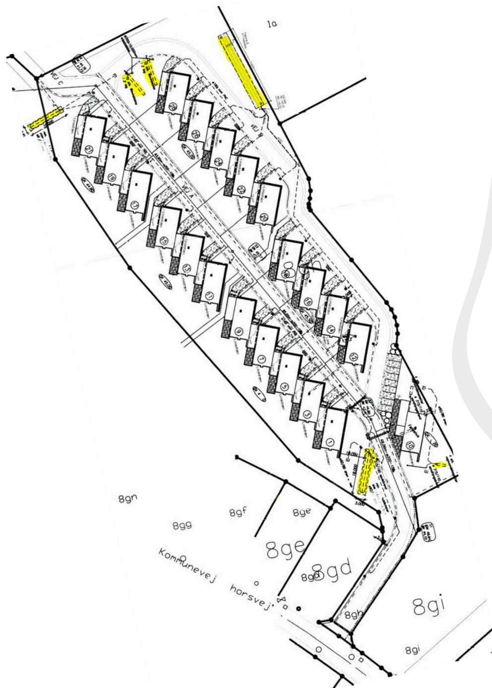
Figur 1 - Andelsboligforeningen Haldursparken – de gule markeringer viser de nuværende faskiner

Andelsboligforeningen Haldursparken består af 20 huse og et fælleshus. Området er spildevandskloakeret og Haldursparken håndterer selv overfladevandet i bebyggelsen. De eksisterende 5-6 faskiner, som er vist med gul på nedenstående skitse blev etableret ved opførelse af bebyggelsen i 2005, og er flere gange blevet ændret eller udvidet.