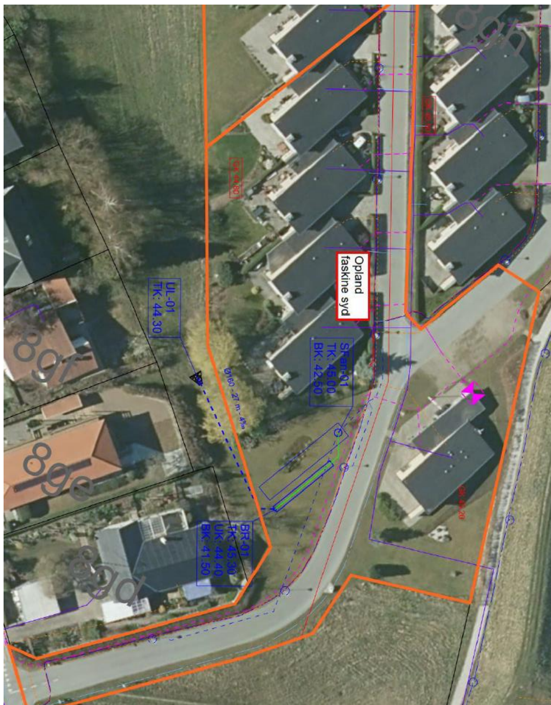
Figur 3 - Oplandet til faskine syd vist med brun markering. Her tilledes en del vejvand, samt vand fra 8 parkeringspladser til fælleshuset etableret i græsarmring.

Ved den nordlige faskine er det kun muligt, at etablere nedgravning gennem et §3 overdrev, og der er derfor meddelt særskilt dispensation den 5. januar 2022. Selve udløbet etableres udenfor §3 arealet.