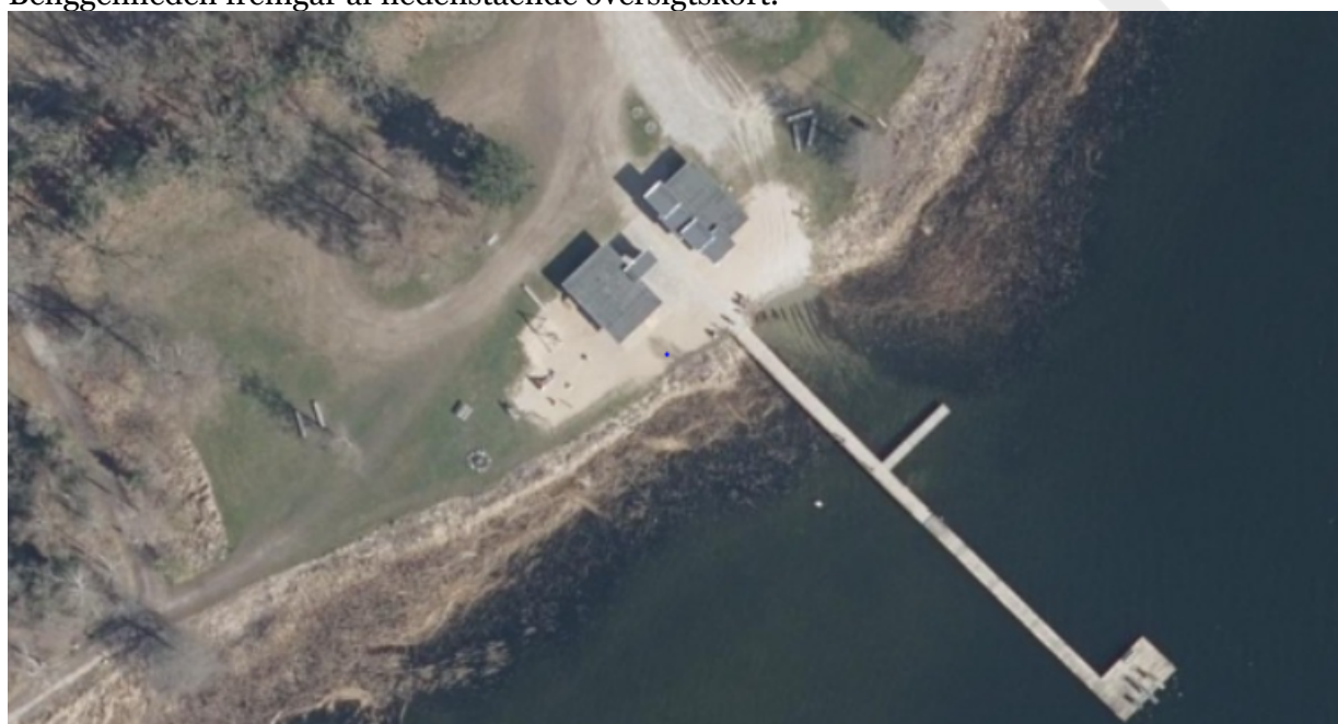
© Kortet må alene anvendes iflg. aftale med kortejer

Beliggenheden fremgår af nedenstående oversigtskort.