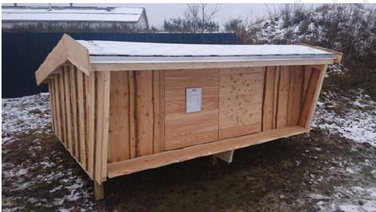
Billede der viser hvordan shelteren ser ud