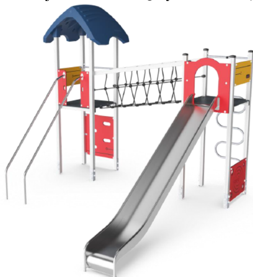
Dobbelttårn med glidestænger

legepladsen. Projektet består af 5 nye elementer, se nedenstående fotos.