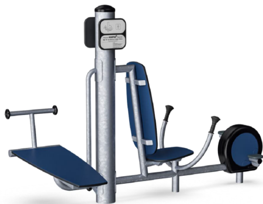
Sit UP Bænk & Power Bike