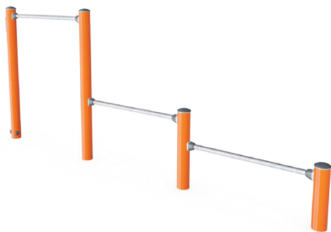
Push Up bars