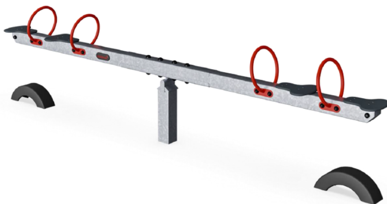
Vippe Med Dæk, Fire Sæder