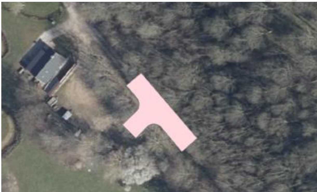
Situationsplan der viser hvor vendepladsen etableres

Baggrunden for vendepladsen er, at Skanderborg Kommune har nedlagt den private fællesvej gennem Vestermølle. På den baggrund opstår der et behov for, at renovationsbiler til Oddervej 86, 90 og 94 kan vende, når de ikke længere kan køre gennem Vestermølle.