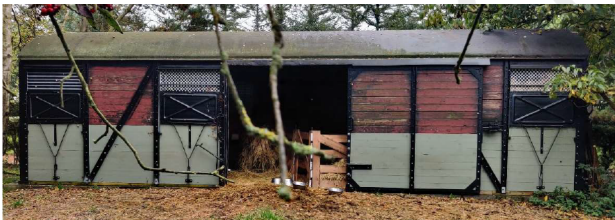
Foto visende facade mod øst.

Nedenfor foto af togvognen, Togvognens mål er 2,78 x 9,4 meter og med en højde på ca, 2,8 meter.