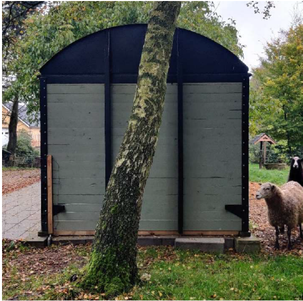
Foto visende facade mod syd.