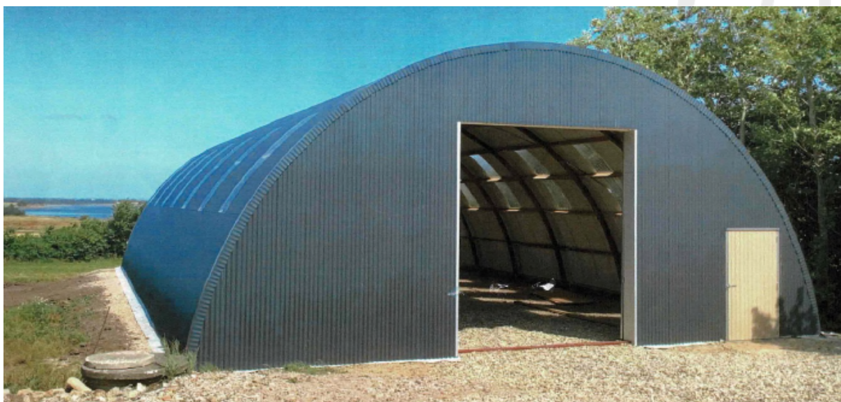
Foto af en lignende rundbuehal