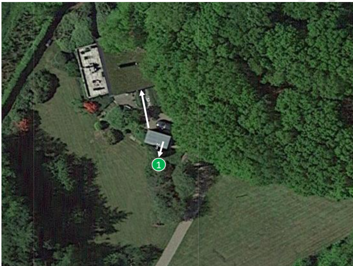
Situationsplan der viser hvor annekset ønskes opført

Du har søgt om tilladelse til, opførelse af et annekts på 9 m 2 med målene 3 m x 3 m og en højde på 2,5 m. Annekset opføres med træbeklædning med brændt træ, og den ene væg er et stort glasparti i form af en dobbeltdør som kan åbne hele siden op. Tagkonstruktionen består af et glastag og fire skodder, der kan foldes ud og fungere som et overdække til området omkring annekset. Skodderne er hvis på indersiden og kaster derfor lys ned i annekset, som får det til at fremstå naturligt oplyst særligt på en mørk vinterdag. Og i opslået tilstand kan de begrænse direkte sollys. Annekset opføres ca. 2 m fra udhuset og inden for ejendommens eksisterende haveanlæg.