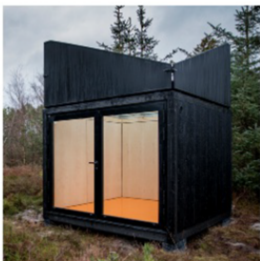
Foto der viser hvordan annekset ser ud