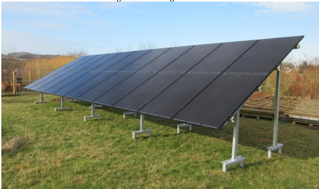
Visualisering fra ansøgningsmateriale.

Nedenfor ses et billede af det ansøgte solcelleanlæg.