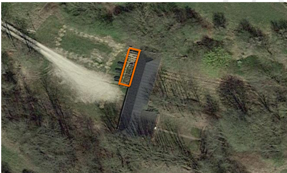
Kort der viser hvor det ansøgte opføres