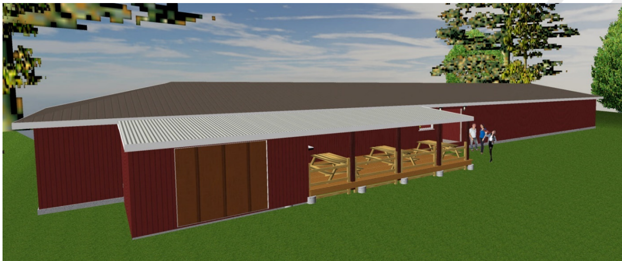
Illustration af det ansøgte

Baggrunden for ansøgningen er, at klubben mangler udeområder.