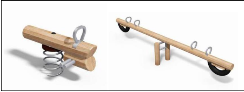
Illustration af tilføjelser. Fjedervippe (tv) og vippe (th). Fra ansøgningsmaterialet.