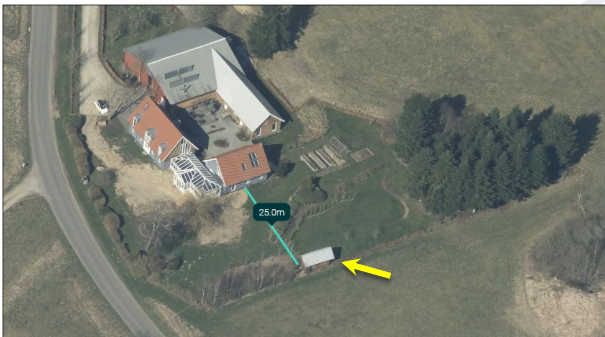
Skråfoto fra 2023. Hønsehuset er opført ca. 25 m syd for ejendommens bygninger. Jf. den gule pil.

Der er søgt om efterfølgende landzonetilladelse til et 13 m 2 stort hønsehus, der er opført i 2014 ca. 25 m syd for stuehuset på Alkenvej 37. Placeringen fremgår af kortet nedenfor.