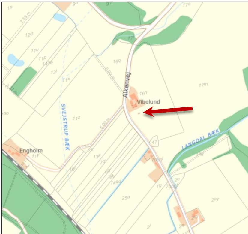
Placeringen af det pågældende hønsehus. Jf. den røde pil på kortet herover.

Der meddeles hermed efterfølgende landzonetilladelse efter planlovens § 35 til et 13 m 2 stort hønsehus, der er opført i 2014 ca. 25 m syd for stuehuset på adressen Alkenvej 37, 8660 Skanderborg. Ejendommen har matr.nr. 16 n Svejstrup By, Dover.