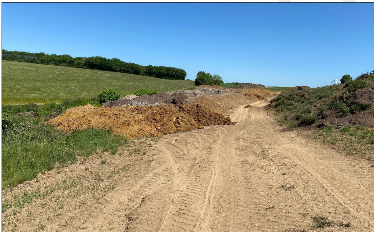
Foto D. 07.06.2023. Overskudsjord, der er kørt ud i en naturlig lavning NØ for bygningerne på Krogdalsvej 8. Foto taget fra S mod N.