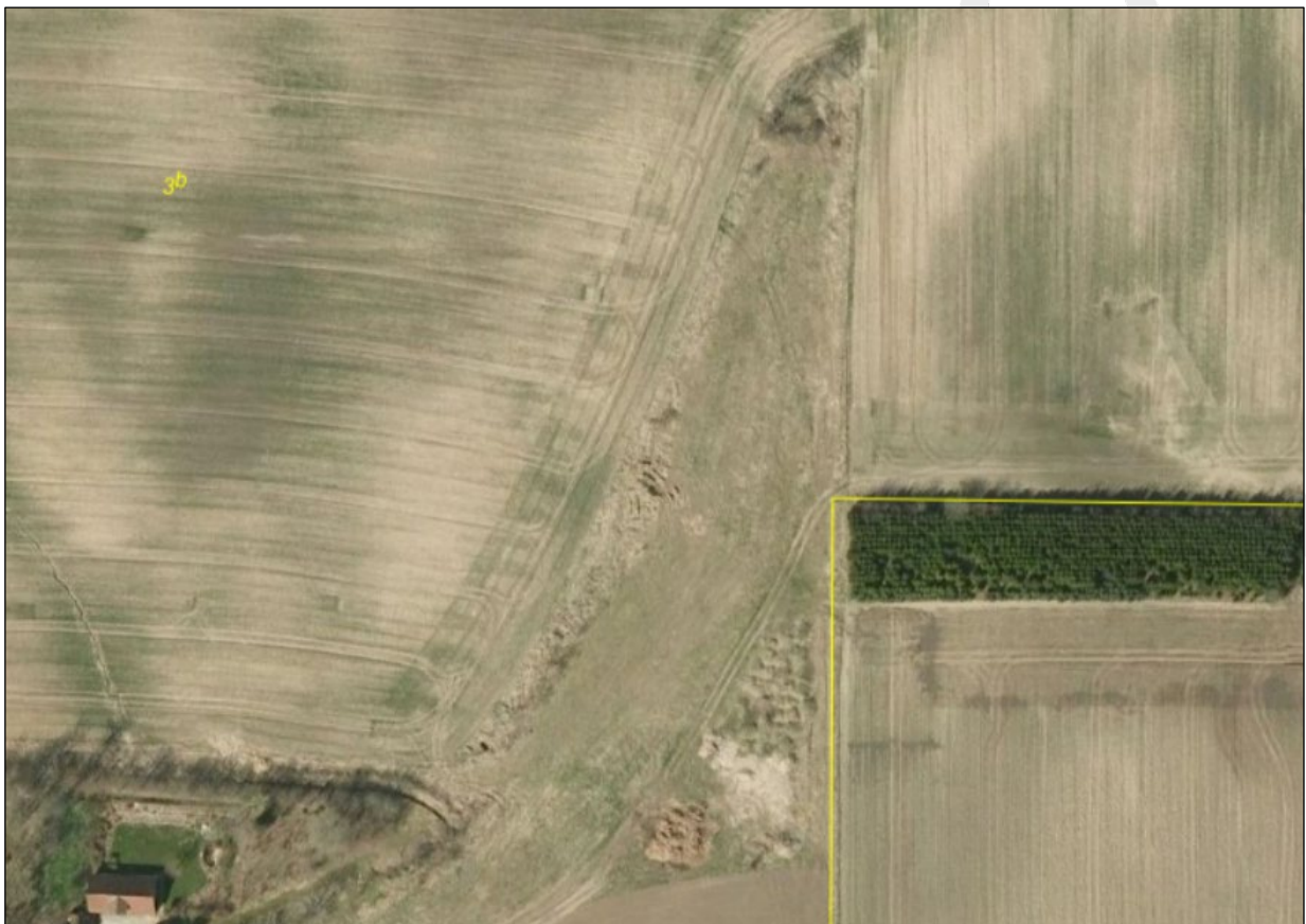
2011. Spor af terrænregulering og jord, der bliver kørt ud i området.