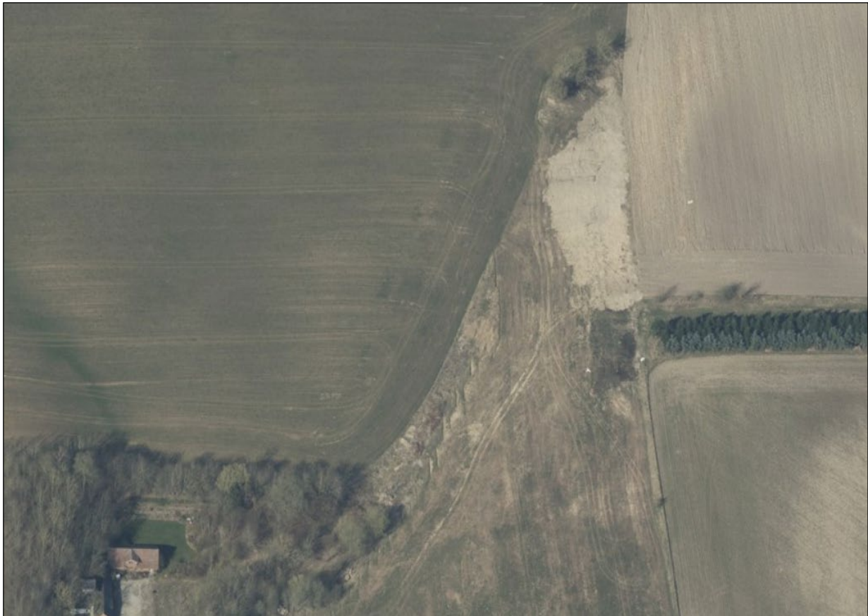
Skråfoto fra den 2. marts 2023. Spor af terrænregulering og jord, der bliver kørt ud i området.