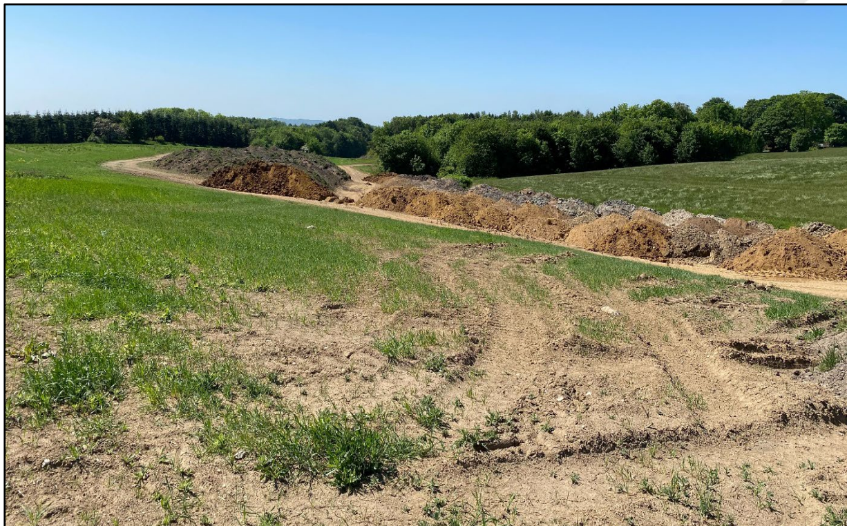
Foto A. 07.06.2023. Overskudsjord, der er kørt ud i en naturlig lavning NØ for bygningerne på Krogdalsvej 8. Foto taget fra NØ mod SV.

Kommunen opfatter ansøgningen om et ønske om at terrænregulere området, sådan at den naturlige lavning i området til dels fyldes op med overskudsjord fra dit byggeprojekt på Østermarksvej 11. Da kommunen besigtigede området den 7. juni blev det konstateret, at oplaget af overskudsjord allerede er etableret i området. Jf. fotos herunder, der er taget på stedet den 7. juni 2023: