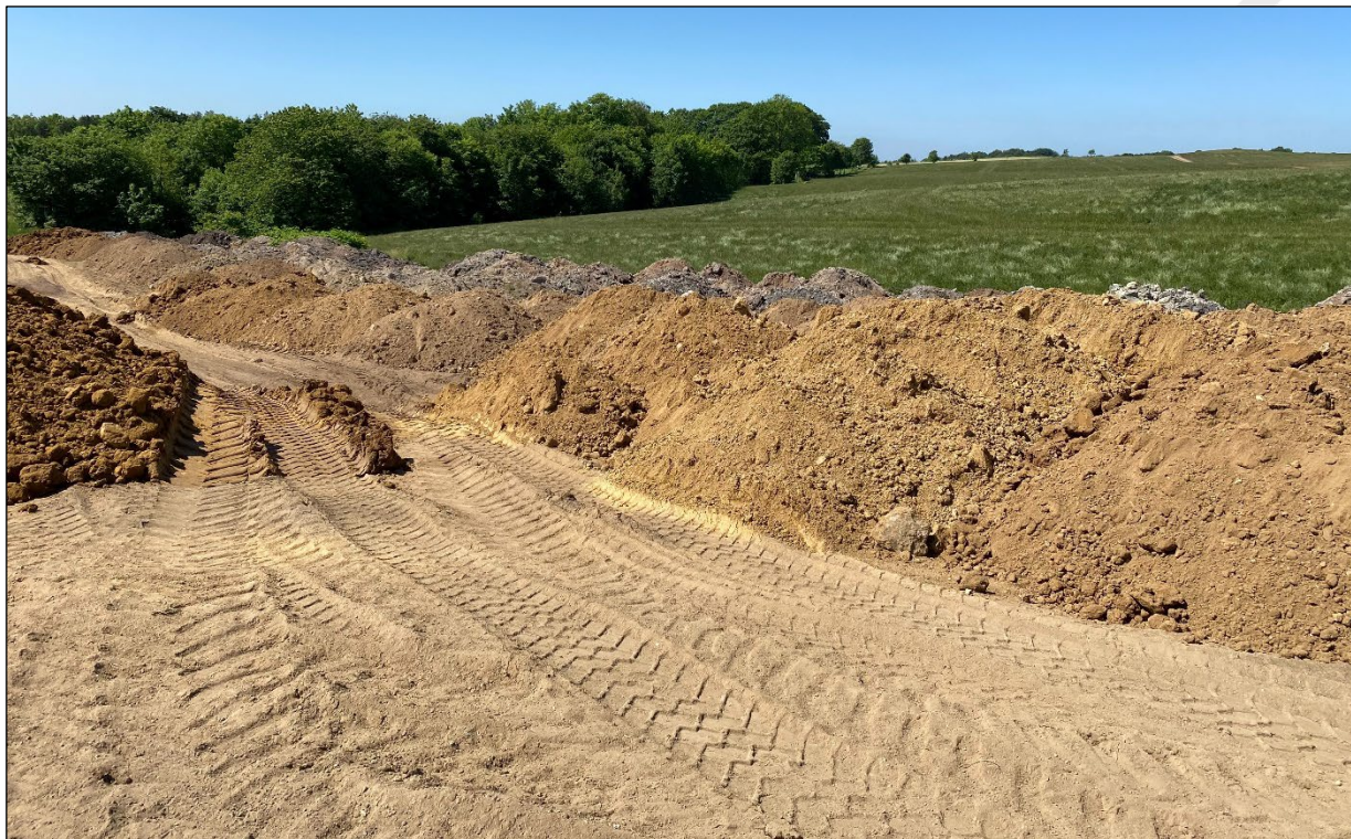
Foto C. 07.06.2023. Overskudsjord, der er kørt ud i en naturlig lavning NØ for bygningerne på Krogdalsvej 8. Foto taget fra N mod S.

Ud af luftfotos af området kan vi se, at lavningen flere gange siden 00'erne ser ud til at have gennemgået en form for terrænregulering med opfyldning og udjævning af jord, uden der søgt om tilladelse til det ved landzonemyndigheden, som før 1. september 2005 var Århus Amt, mellem 1. september 2005 og 31. december 2006 var tidl. Ry Kommune og efter 1. januar 2007 er nuværende Skanderborg Kommune. Jf. fotos på de næste sider: