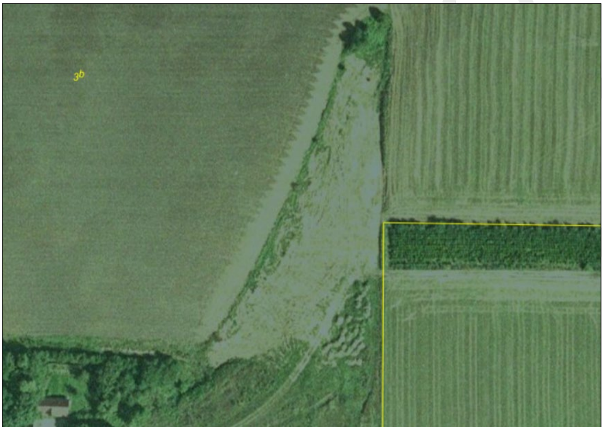
2005. Spor af terrænregulering og jord, der bliver kørt ud i området.