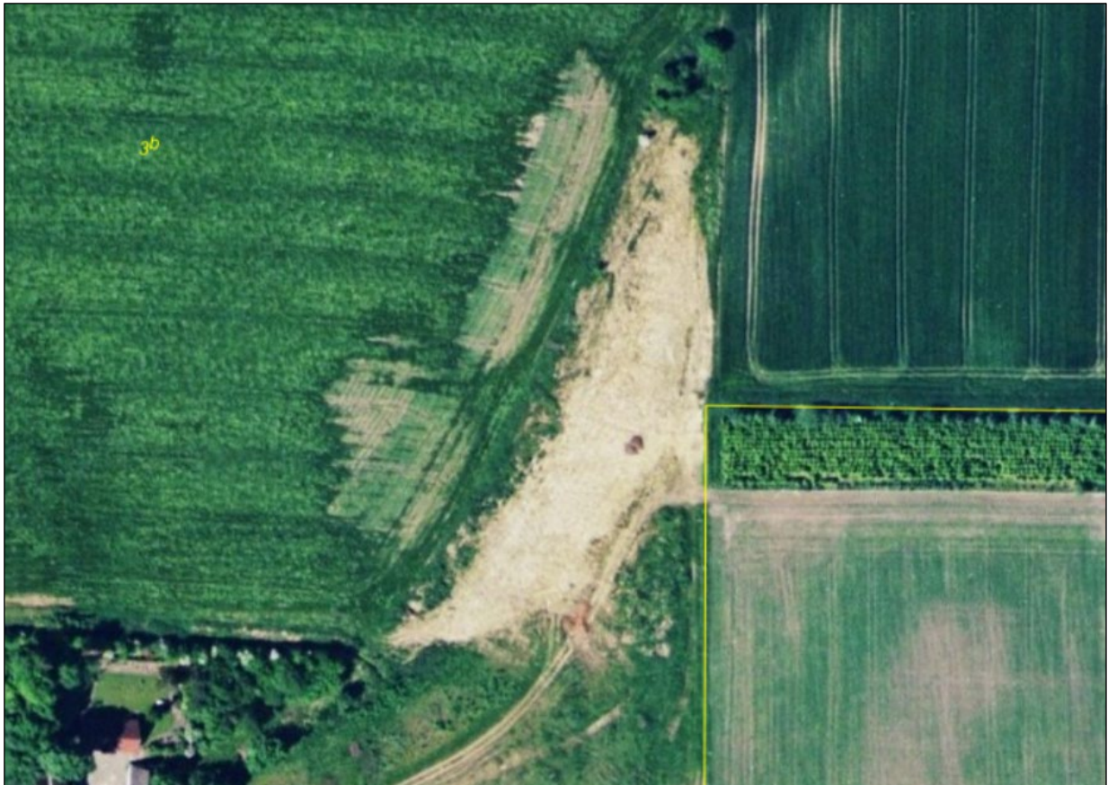
2006. Spor af terrænregulering og jord, der bliver kørt ud i området.