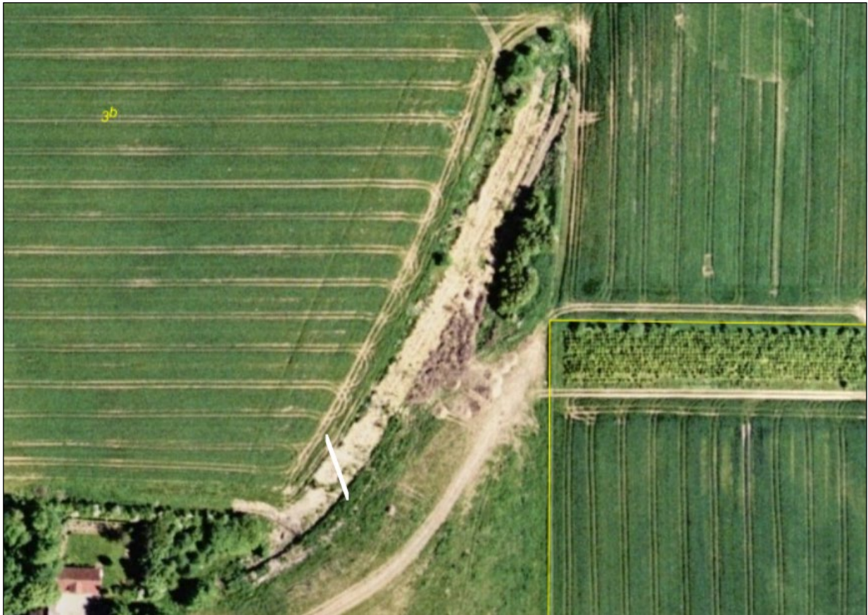
2004. Spor af terrænregulering og jord, der bliver kørt ud i området.