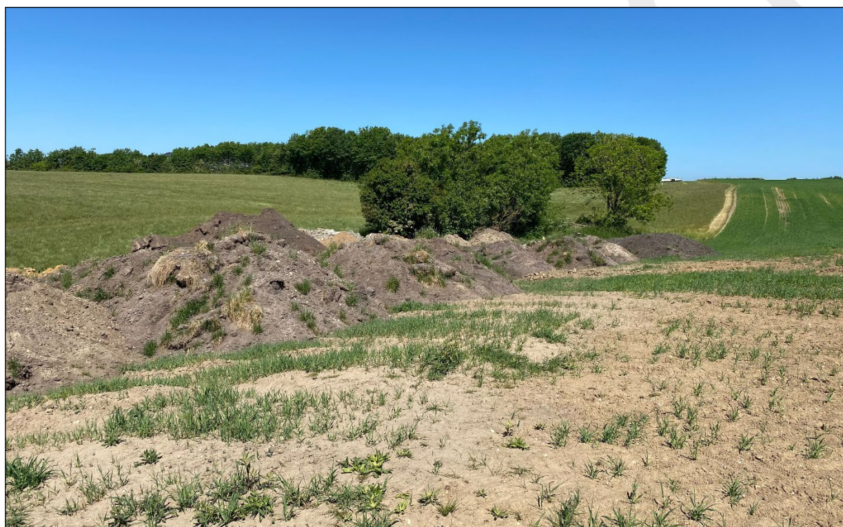
Foto B. 07.06.2023. Overskudsjord, der er kørt ud i en naturlig lavning NØ for bygningerne på Krogdalsvej 8. Foto taget fra S mod N.