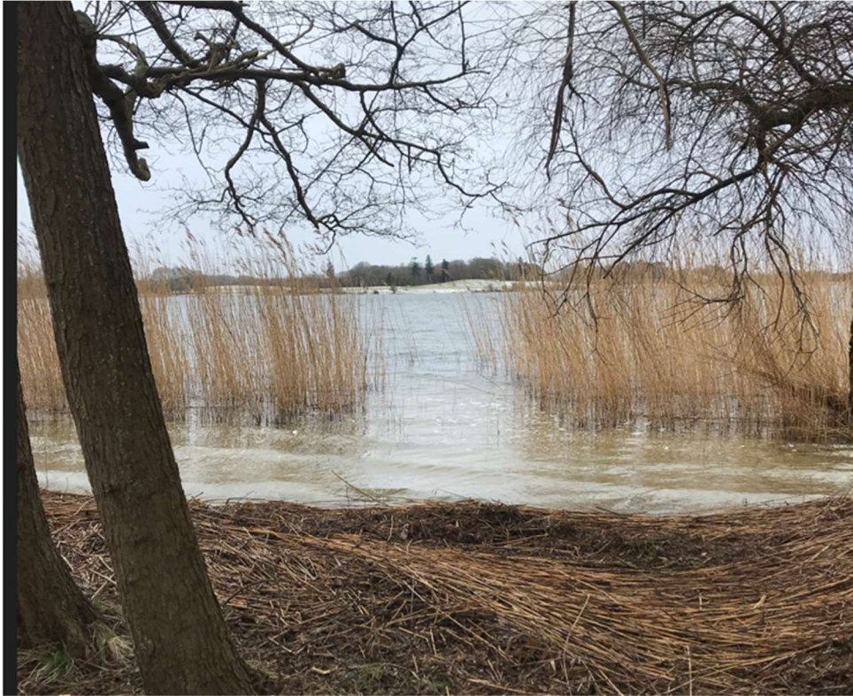
Foto fra besigtigelsen 7. marts 2023 viser den smalle passage gennem tagrørene.

På baggrund af gennemgangen af luftfotos og oplysninger fra ansøgningen og besigtigelsen vurderer vi, at broen, med sin størrelse (max. 8 m) og aktuelle placering, ikke skaber afstrømnings- eller passagemæssige gener. Da broen kan placeres i en åbning, hvor der ikke er rørskov, vurderes det ansøgte heller ikke at medføre en væsentlig ændring af naturtilstanden.