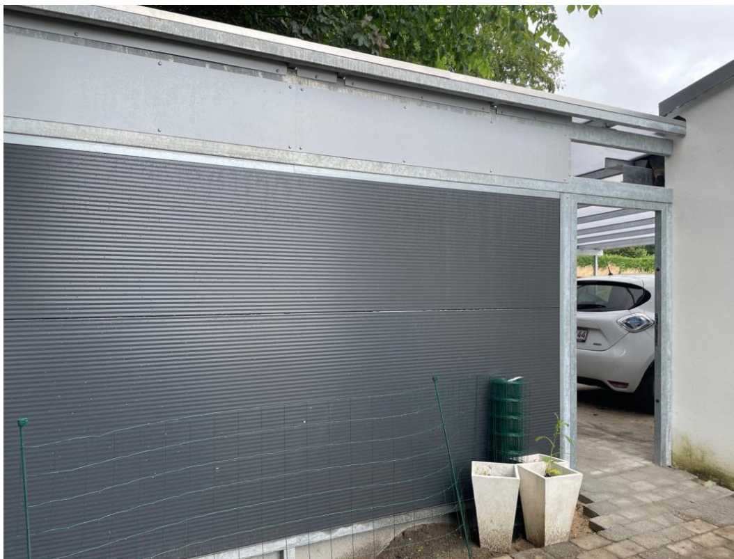
Carportens konstruktion og materialer.