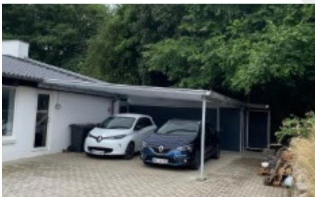
Carporten set fra vejen.

Vi har vedlagt relevante billeder og tegninger af carporten fra ansøgningsmaterialet herunder.