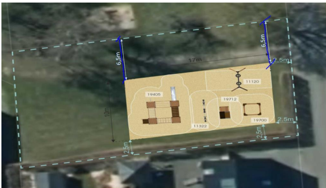
Legepladsens placering på grunden med afstande til skel og vej samt adgangsvej for køretøjer.

Afstande til skel og vej samt adgangsvej for køretøjer fremgår af nedenstående kort.