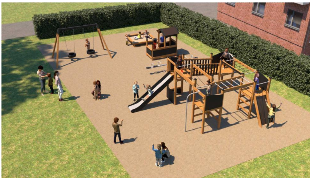
Principiel visualisering af legepladsen med legeredskaberne.

Legepladsens udformning fremgår af nedenstående illustration.