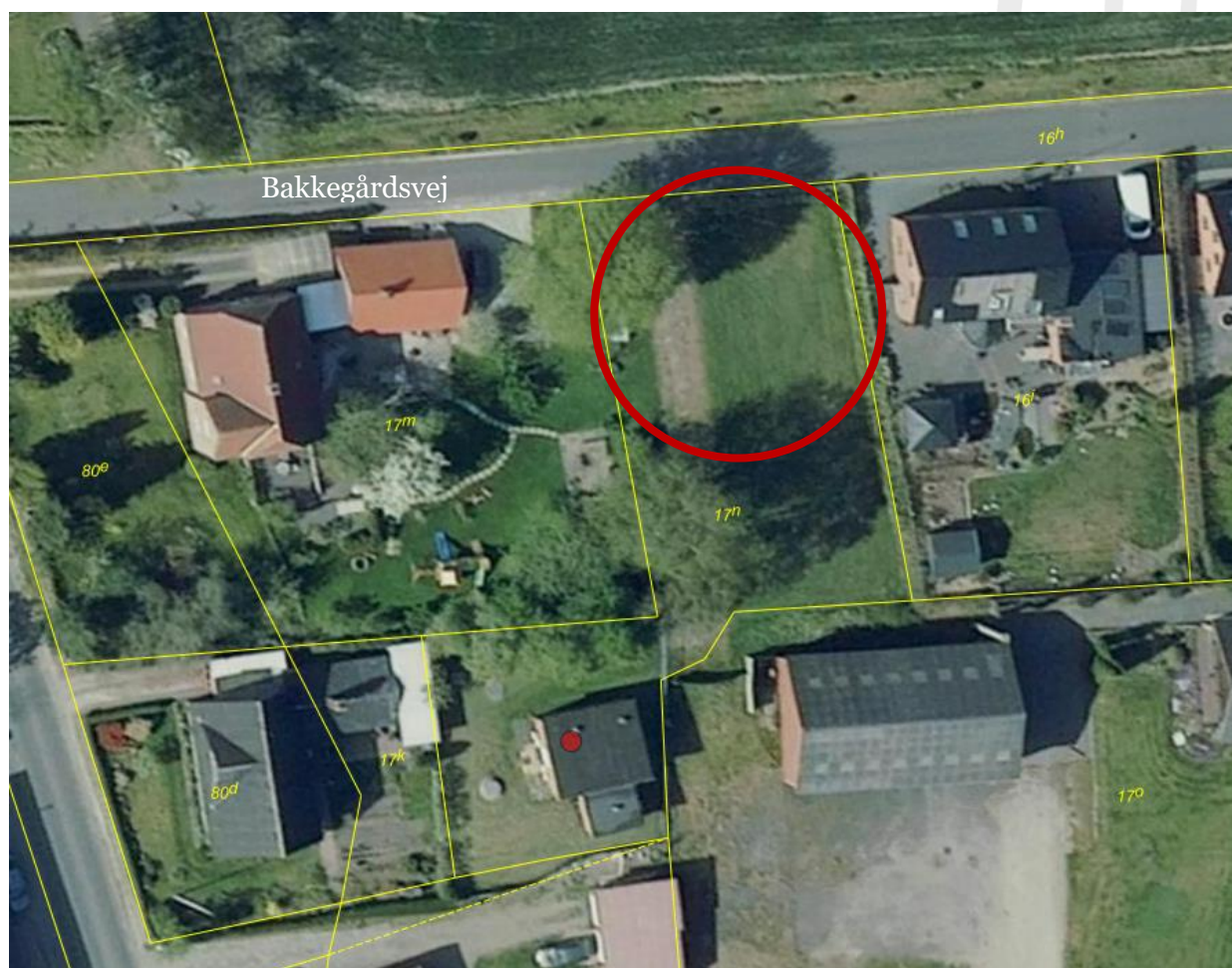
Luftfoto, der viser placeringen af legepladsen (rød cirkel) på arealet tilhørende I/S SJELLE VANDVÆRK.

Placeringen af legepladsen fremgår af nedenstående kort.