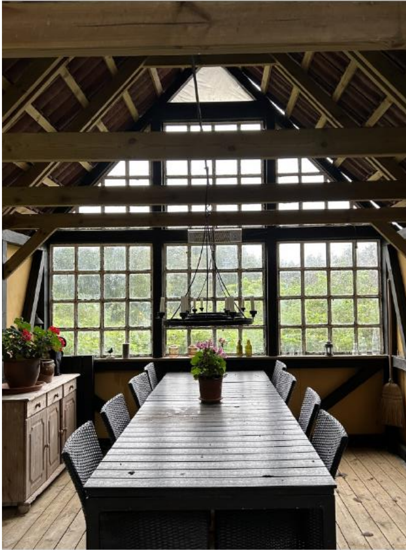
Grillhuset set indefra ud imod gavl mod vest.