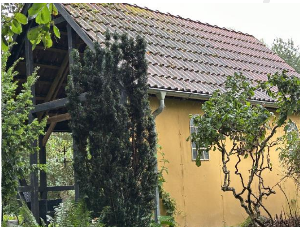
Grillhuset set fra nordøst.