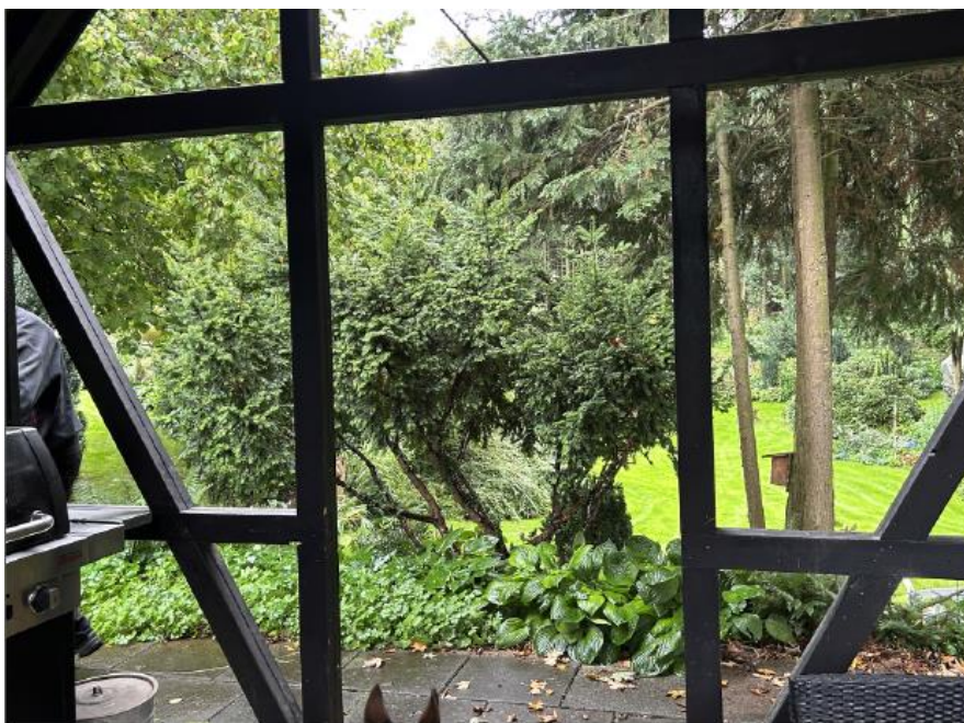
Grillhuset set indefra ud imod gavl mod øst.