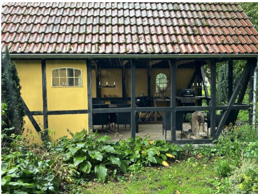
Grillhuset set fra syd.

Vi har vedlagt relevante billeder af grillhuset fra ansøgningsmaterialet herunder.