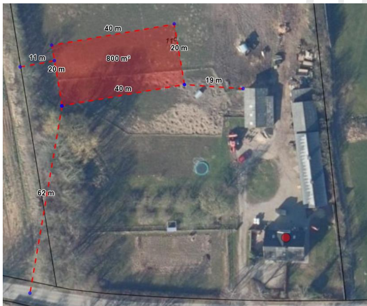
Kort, der viser placeringen af ridebanen samt afstande til bestående bebyggelse (løsdrift stald), naboskel og vej. Fra ansøgningsmaterialet.

Placeringen af ridebanen fremgår af kortet nedenfor.