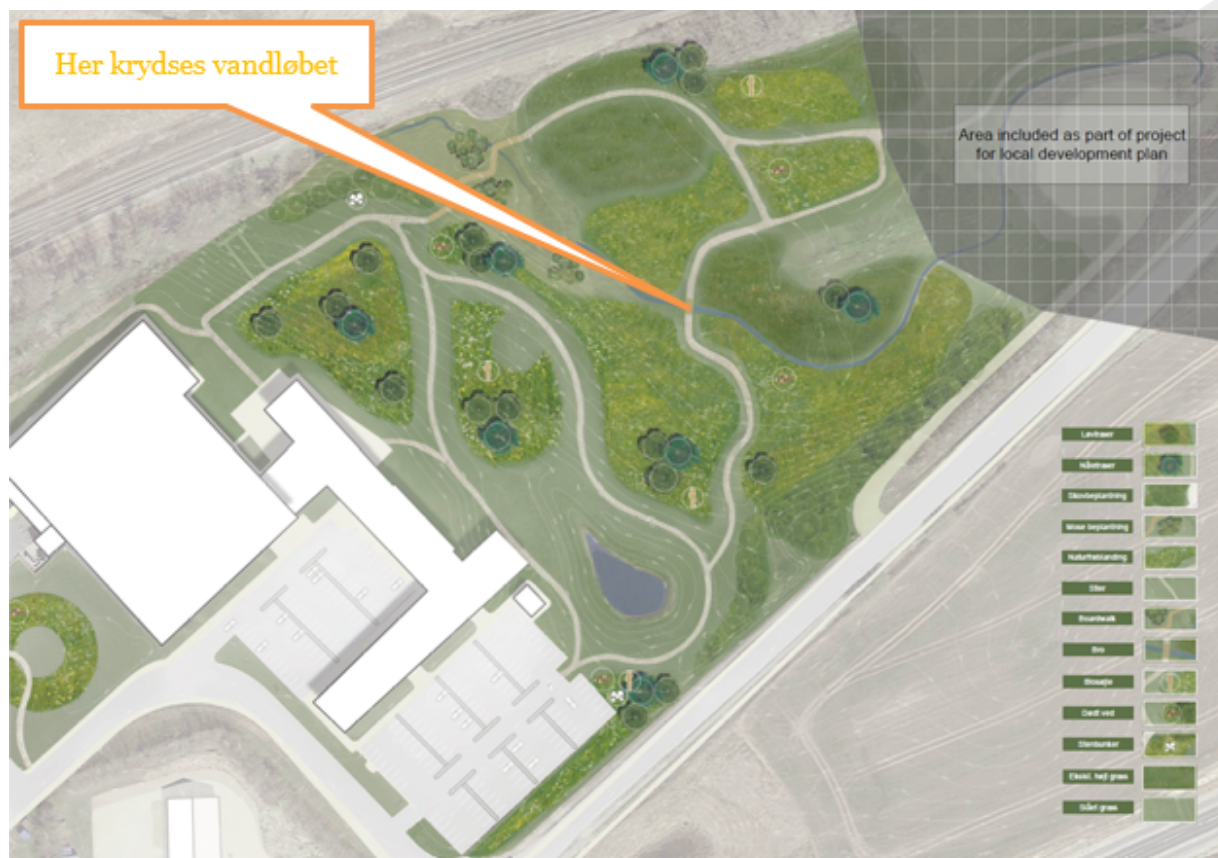
Figur 1: Krydsningspunkt

Tilladelsen bortfalder, hvis ikke den er udnyttet inden 3 år, efter den er meddelt.