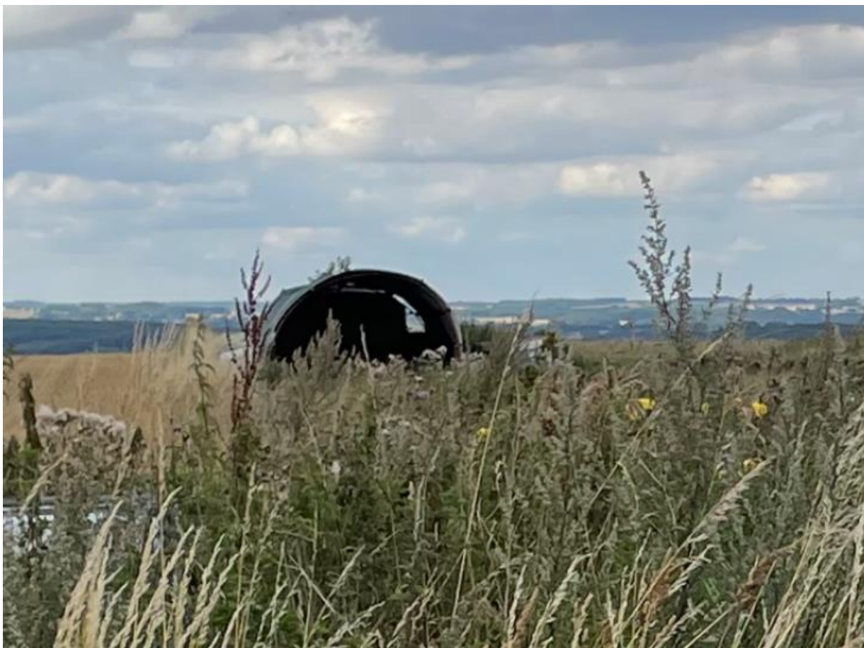
Rundbuehallen set mod gavl.