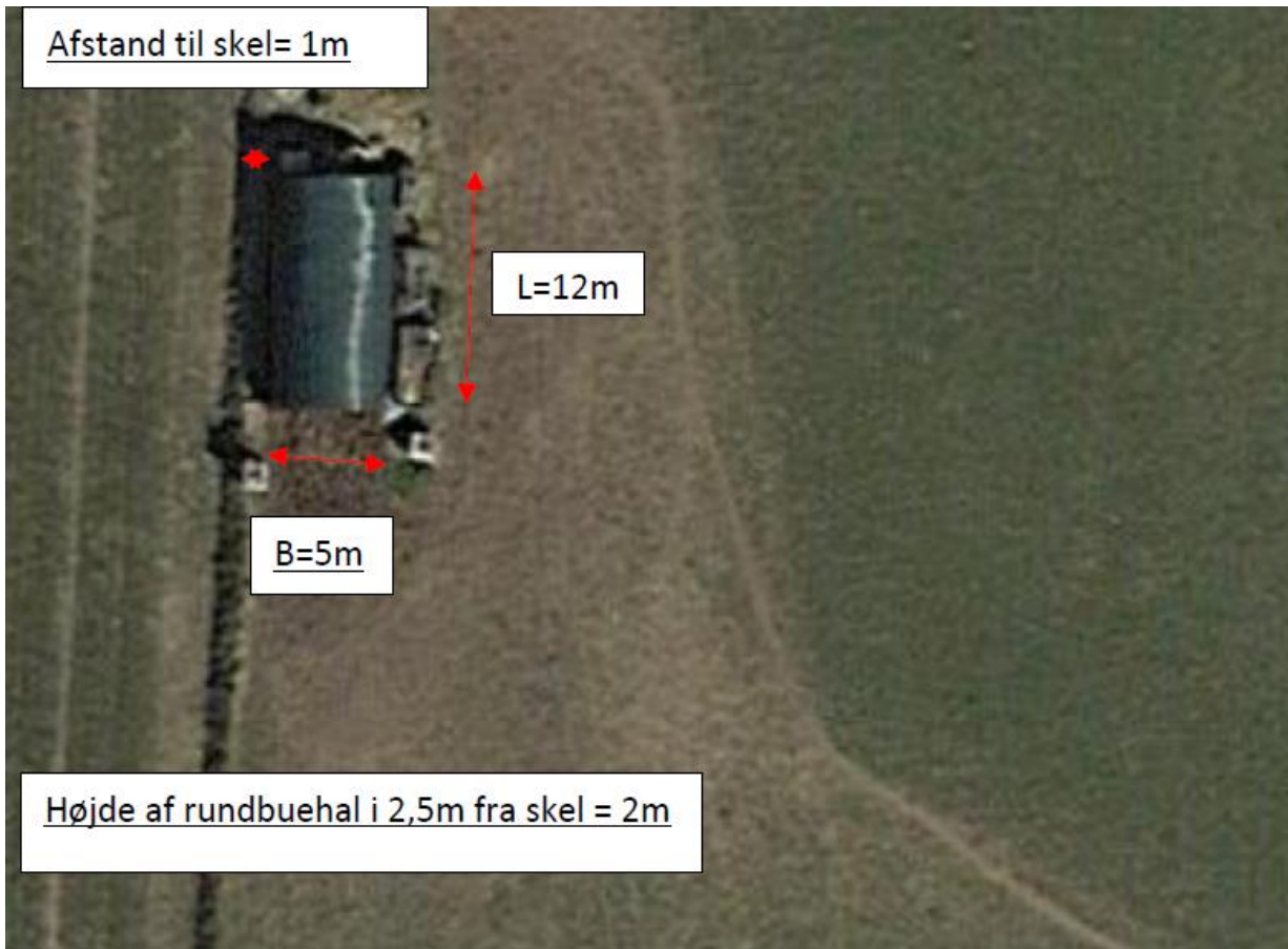
Luftfoto, som viser rundbuehallens omfang samt afstand til skel.