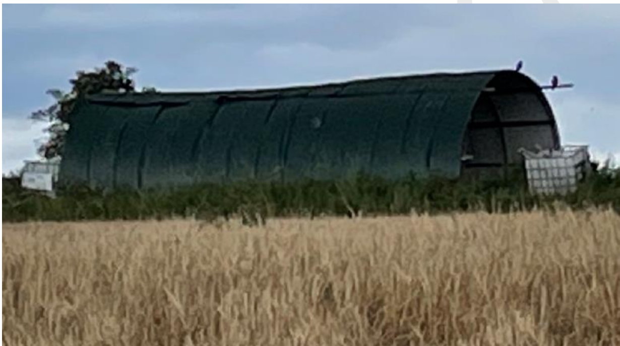
Rundbuehallen set fra siden.