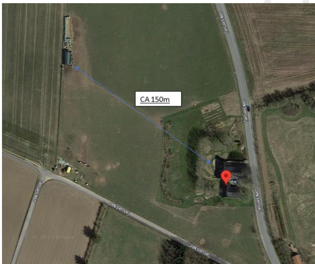
Luftfoto, som viser rundbuehallens placering i forhold til ejendommens bestående bygninger.

Placeringen af rundbuehallen fremgår af kortet nedenfor.