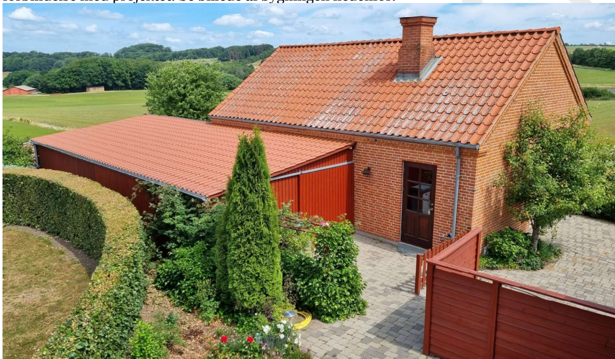
Udhuset ses til højre for maskinhuset. Udhuset har ensidet taghældning.

Udhuset er ca. 51 m 2 med målene 11,30 x 4,55 meter. Højden på bygningen er 1,80 meter på ydervæggen og 2,37 meter mod maskinhuset, idet der er hældning på taget. Taget er med røde stålplader og væggene er af rødmalet træ med 2 mm mellemrum. Terrænet er ikke ændret i forbindelse med projektet. Se billede af bygningen nedenfor.