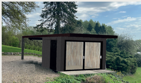
Det nye anneks/carport

Illustrationer der viser den nuværende carport/udhus og den nye carport/anneks