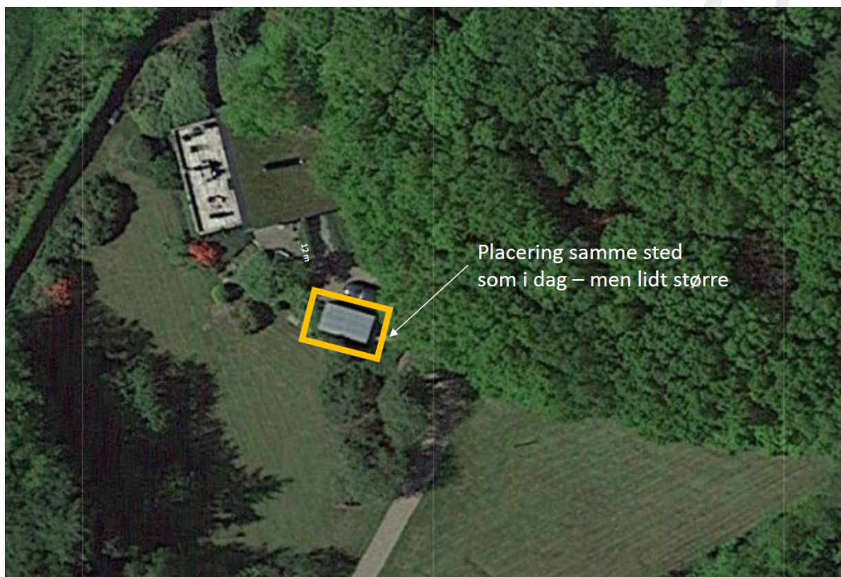
Situationsplan der viser hvor carporten/annekset ønskes opført

Du har søgt om tilladelse til, at opføre en carport med anneks på 34 m 2 med målene 9 m x 3,7 m og en højde på 2,54 m til erstatning for eksisterende carport/udhus på m 2 som nedrives. Annekset bliver ca. 10 m 2 og carporten bliver ca. 19 m 2 . og et lille udhæng på ca. 3, 5 m 2 . Det eksisterende byggeri trænger til en opgradering. I stedet for udhuset ønskes et annekset som er isoleret. Byggeriet opføres med samme placering som den nuværende carport og ca. 12 m fra boligen. Byggeriet opføres med udhæng og opføres med sort malet bejset træ. Carporten er åben og ved annekset er der en dobbelt glasdør i enden. Taget er sedumtag som ligner taget på boligen. med brændt træ, og den ene væg er et stort glasparti i form af en dobbeltdør som kan åbne hele siden op.