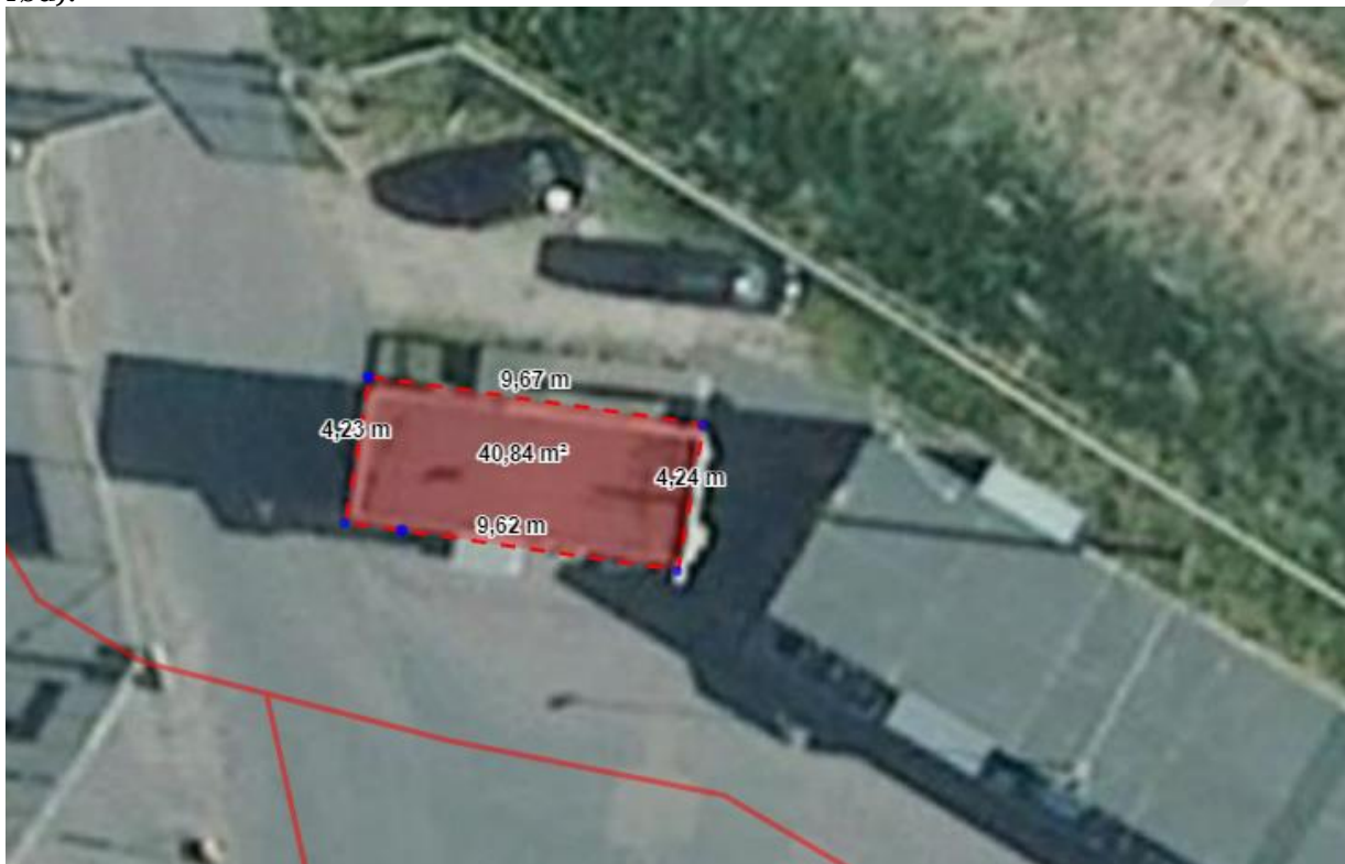
Fra ansøgningsmaterialet: den eksisterende mandskabsvogn.

Den nye mandskabsvogn bliver ca. 45 m 2 , og den placeres samme sted som den eksisterende. Pavillonen bliver med træbeklædning på siderne og tagpap på taget. Højden inkl. fundament bliver ca. 3,5 meter. Nedenfor ses hvor den nuværende pavillon er placeret (markeret med rød).