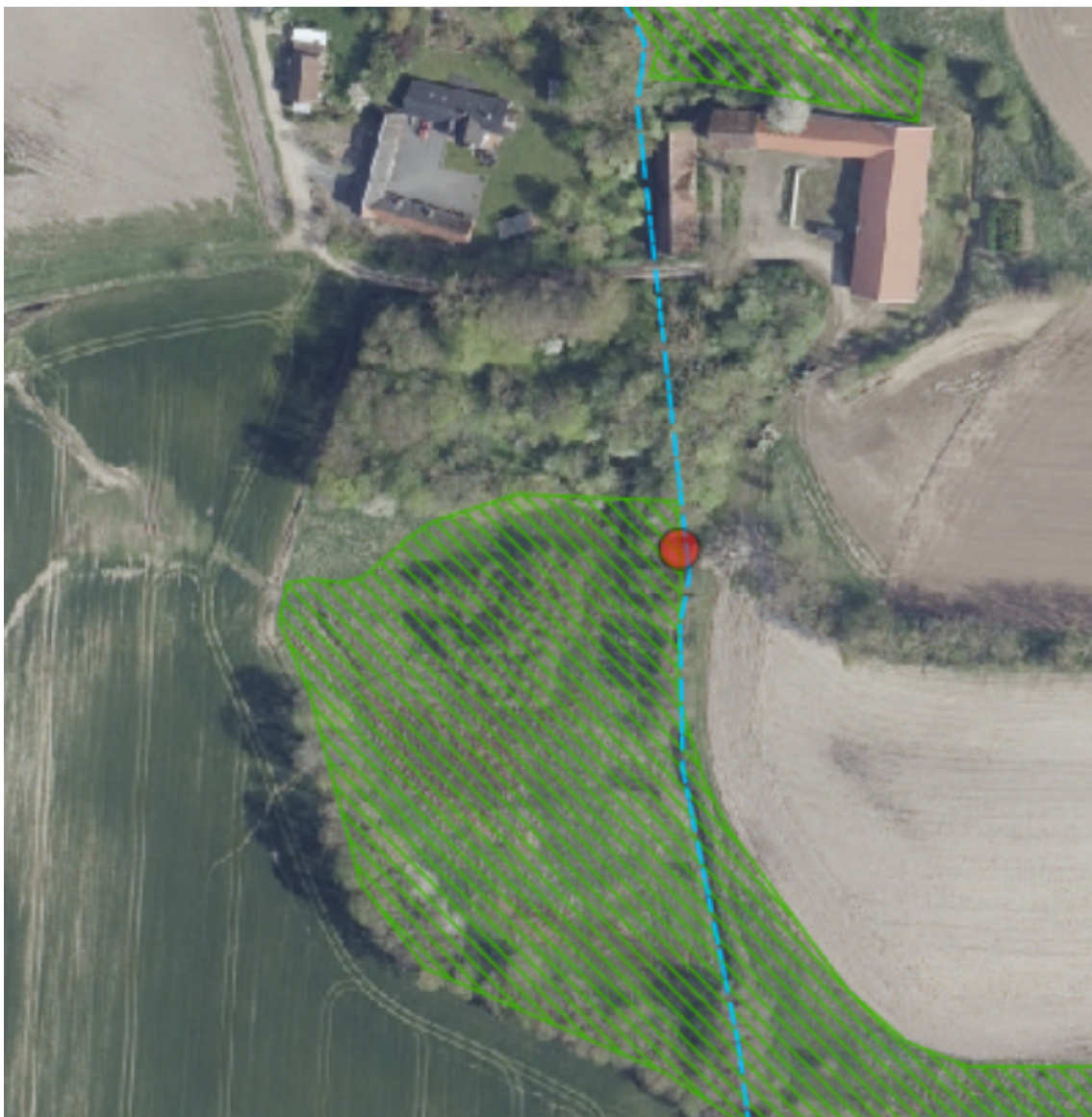
Figur 3. Krydsningsstedet over Borum Møllebæk (rød prik). Krydsningen sker i matrikel 2a, Terp By, Skivholme ved styret underboring. Det skraverede område er vejledende udpeget som beskyttet eng iht. naturbeskyttelseslovens §3.