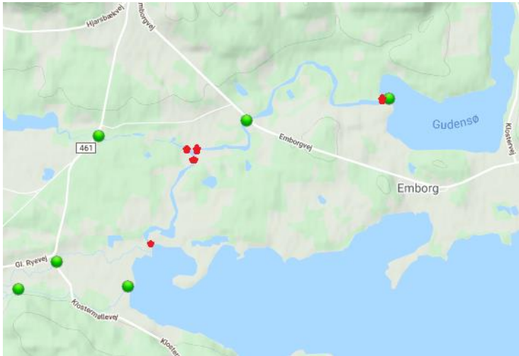
Figur 3 Røde punkter angiver, hvortil der er udtaget oplande til anvendelse ved hydrauliske beregninger.

Der er bestemt oplande ved røde markeringer angivet på Figur 3 nedenfor.